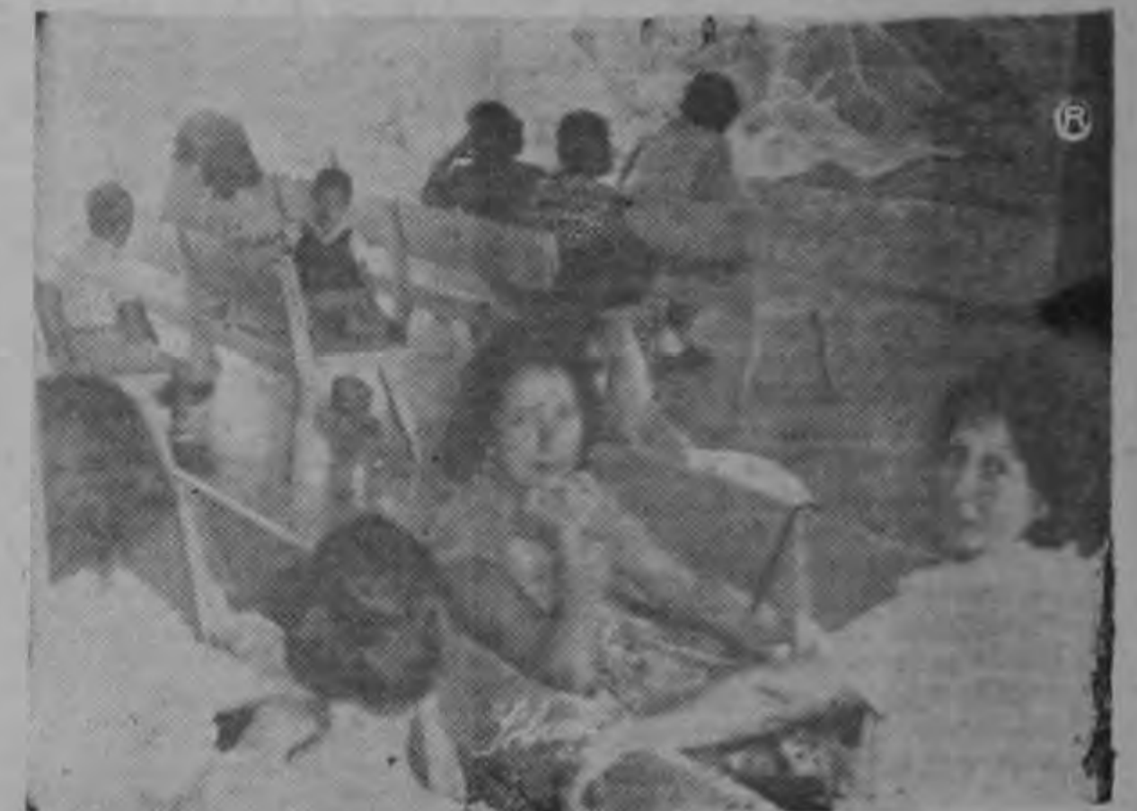
PACIENTES de la Maternidad Carit esperan la terminación del cese de actividades que durante una hora mantuvo ayer el personal de la Institución.

mento se ha causado perjuicio a la comunidad a la que atende, ni a los pacientes allí internados.