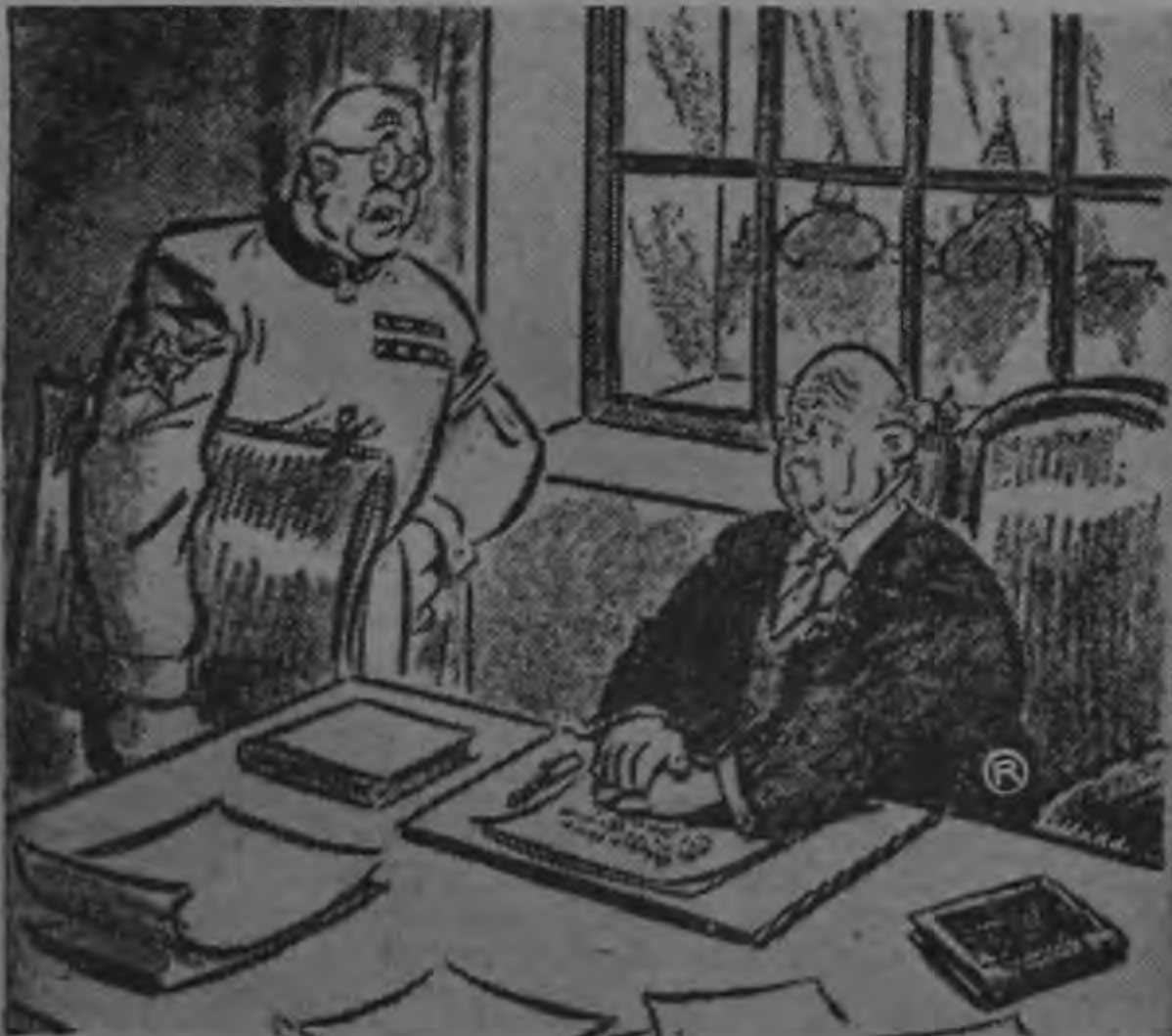
"Y cuando todo el mundo sea comunista, ¿dónde obtendremos el trigo?"

Anteriormente un escampavía de la guardia costera, Nemesis, dijo haber hallado restos en un lugar a 60 kilómetros al noreste de Cayo Hueso y a 270 kilómetros al norte de Cuba.