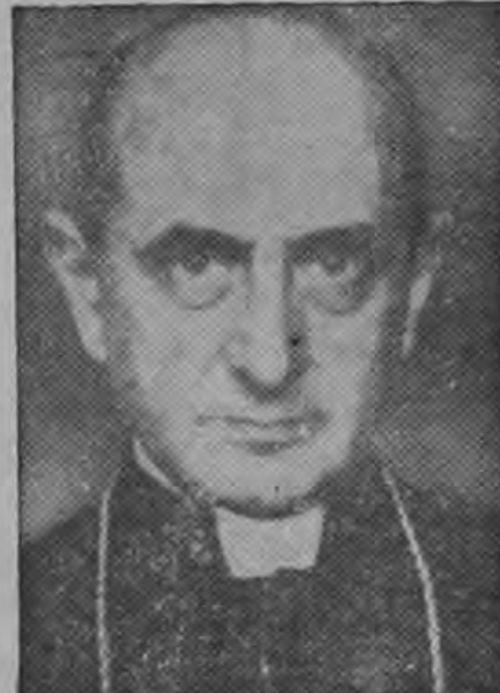
Su Santidad PAULO VI

CIUDAD DEL VATICANO, 21. AP—El Papa Paulo VI recibió hoy en audiencia privada al ingeniero Edgardo Seoane, primer vicepresidente del Perú, que se encuentra en Roma para asistir a la Asamblea General de la Organización para la Alimentación y la Agricultura (FAO).