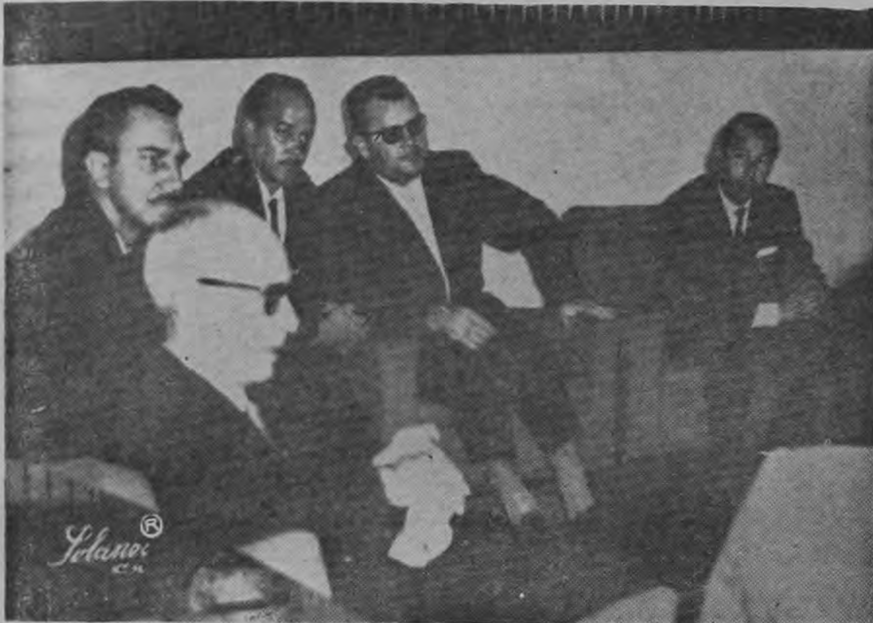
OTRA GRAFICA de los representantes de Limón vicia por hacer realidad la promesa de la carretera a Limón.