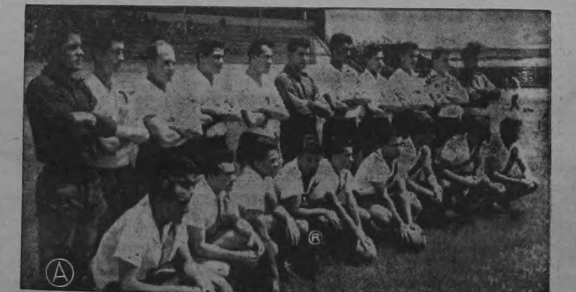
El próximo domingo comienza la cuadrangular final de la Liga Mayor de Fútbol con dos partidos de la mayor importancia. En el estadio manudo como preliminar del juego copero de manudos y morados se van a enfrentar Nicolás Marín y El Carmen. También lo harán los los equipos portoneños Limón y Puntarenas en el estadio puntarenense a las dos de la tarde. Este cuadrangular se jugará bajo el sistema de todos contra todos obteniendo el título de campeón de ascenso el cuadro que logre la mayor puntuación. Automáticamente adquirirá también el derecho de jugar en el torneo de promoción frente al Herediano que quedó último en el torneo superior.