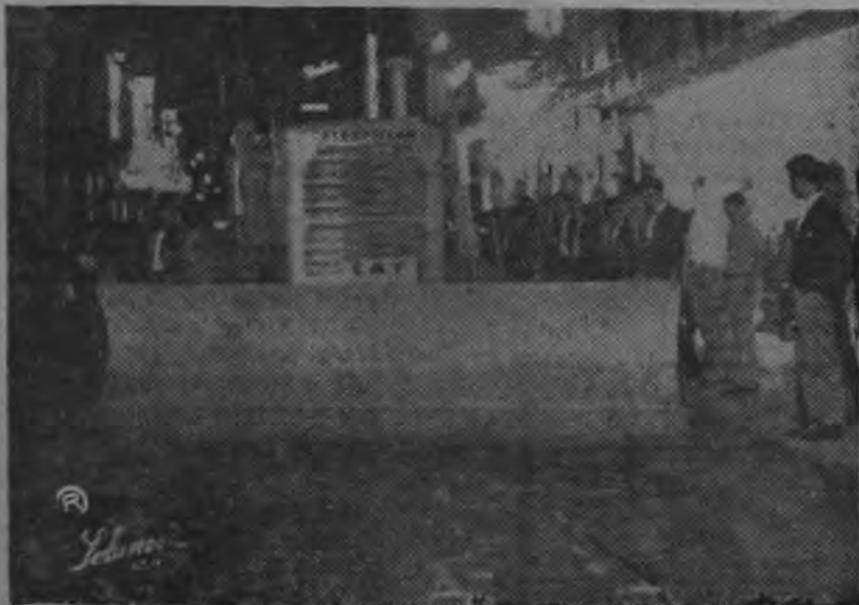
LA CELERIDAD DE LOS PLANES urgentes de arreglo de nuestras principales calles, que vienen ejecutando la Municipalidad y el Ministerio de Transportes, está representada por la actividad febril de esta motoniveladora, que trabajó en la Avenida Central ayer hasta horas de la noche. El público josefino, mira como ¡al fin! las calles serán arregladas.

En este mismo navío viaja el Comodoro E. B. Ashmore, Comandante de las Fuerzas Británicas del Área del Caribe.