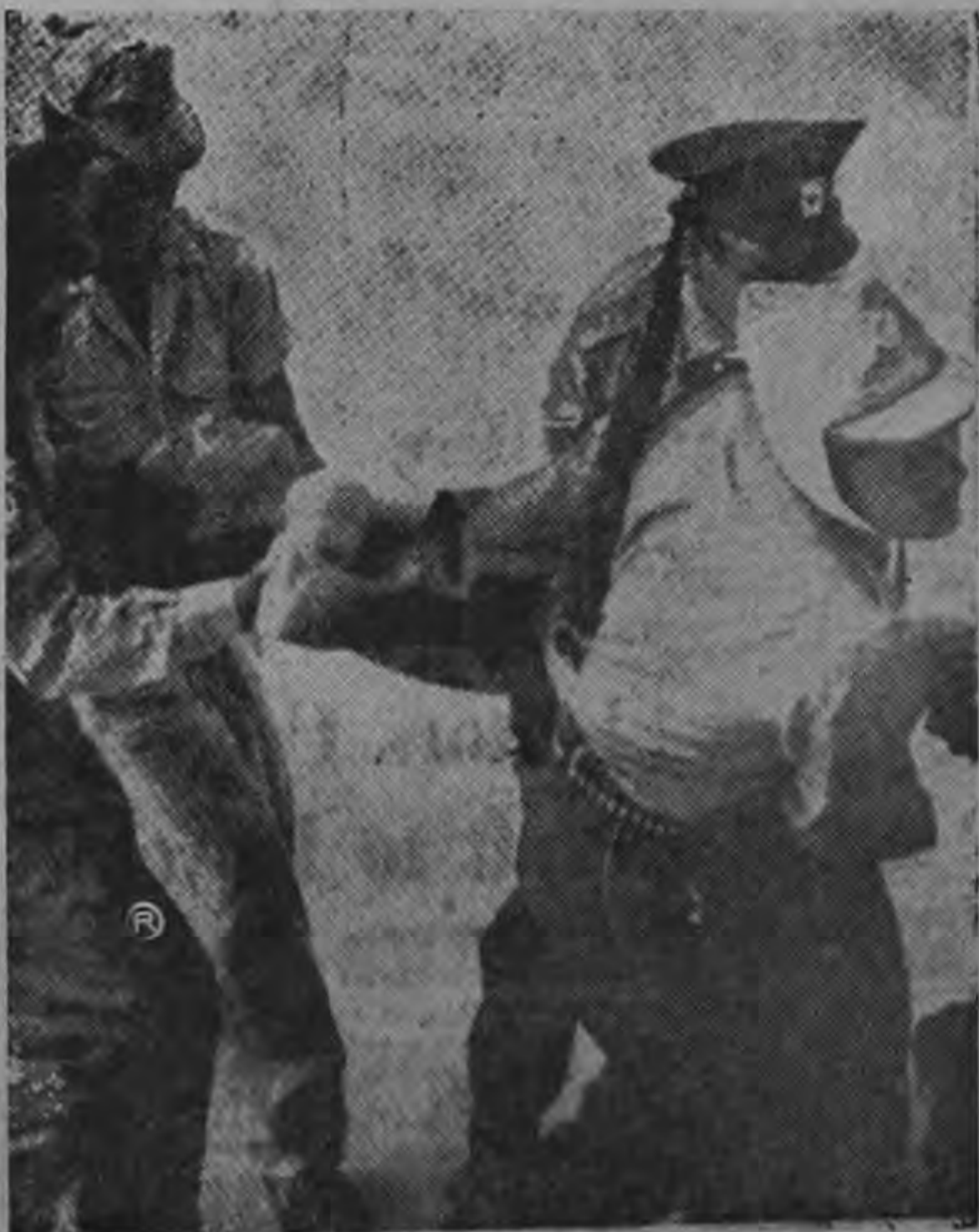
DRAMATICA FOTOGRAFIA que muestra a un grupo de militares venezolanos cuando trasladaban a un civil herido en las refriegas entre terroristas y fuerzas armadas del gobierno de Rómulo Betancourt. El saldo hasta ahora arroja varias docenas de muertos y más de un centenar de heridos.

El texto del mensaje aún no fue dado a la publicidad.