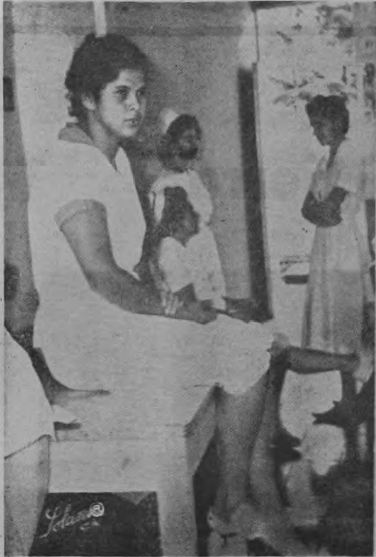
PERSONAL DE ENFERMERIA de la Maternidad Carit durante un paro de una hora llevado a cabo ayer por empleados de la Institución, como protesta por el atraso en los pagos de los sueldos.

Los empleados de la Maternidad Carit efectuaron ayer un paro de una hora por falta de pago. Esta obligación debió efectuarse el quince de este mes.